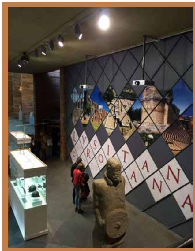
Figura 3 Inauguração da Exposição internacional "Lusitania Romana. Origen de dos pueblos / Lusitânia Romana. Origen de dois Povos" no Museu Nacional de Arte Romana de Espanha - Mérida, a 23 de Março de 2015.