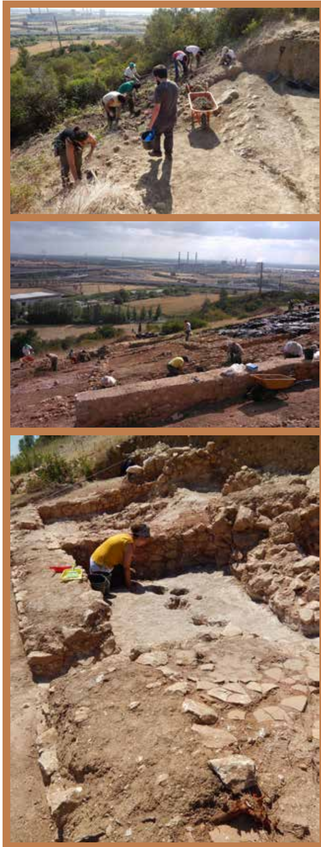
Figura 14, 15 e 16 Campo Arqueológico Monte dos Castelinhos 2015.