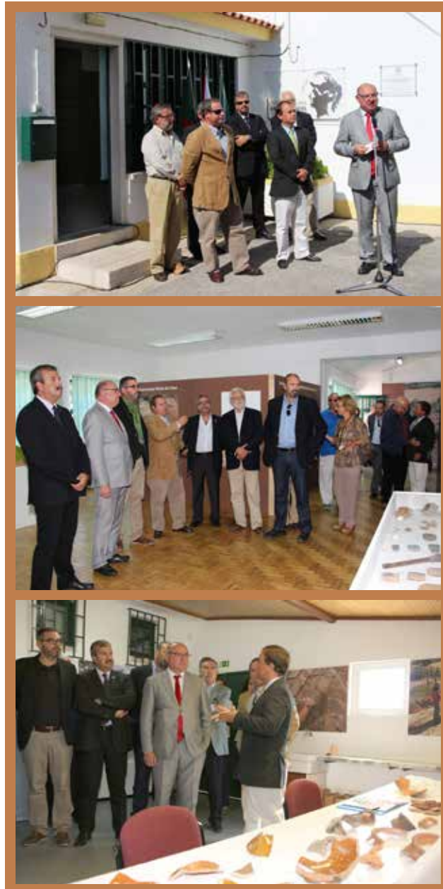
Figura 7, 8 e 9 Inauguração do Centro de Estudos Arqueológicos de Vila Franca de Xira – CEAX e da Exposição – “Arqueologia em Vila Franca de Xira. O desvelar de um património milenar”, a 26 de Setembro de 2015.