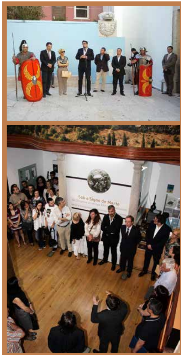
Figura 5 e 6 Inauguração da Exposição "O sítio arqueológico de Monte dos Castelinhos" no Núcleo Museológico do Mártir Santo em Vila Franca de Xira, a 16 de Maio de 2015.