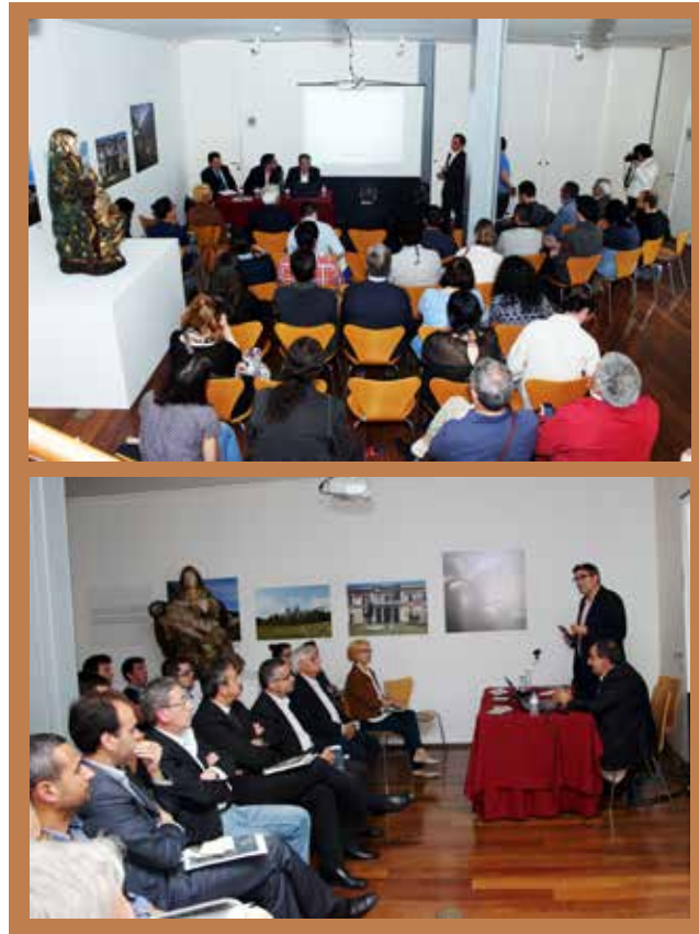
Figura 1 e 2 Apresentação pública da Revista CIRA Arqueologia N.º 3, a 6 de Maio de 2015.