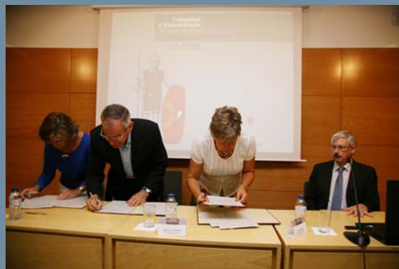
N.º 1 e 2 Inauguração da Exposição Monte dos Castelinhos no Museu Nacional de Arqueologia.