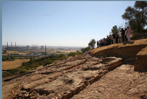
N.º 4 Decorrer do Congresso Conquista e Romanização do Vale do Tejo.