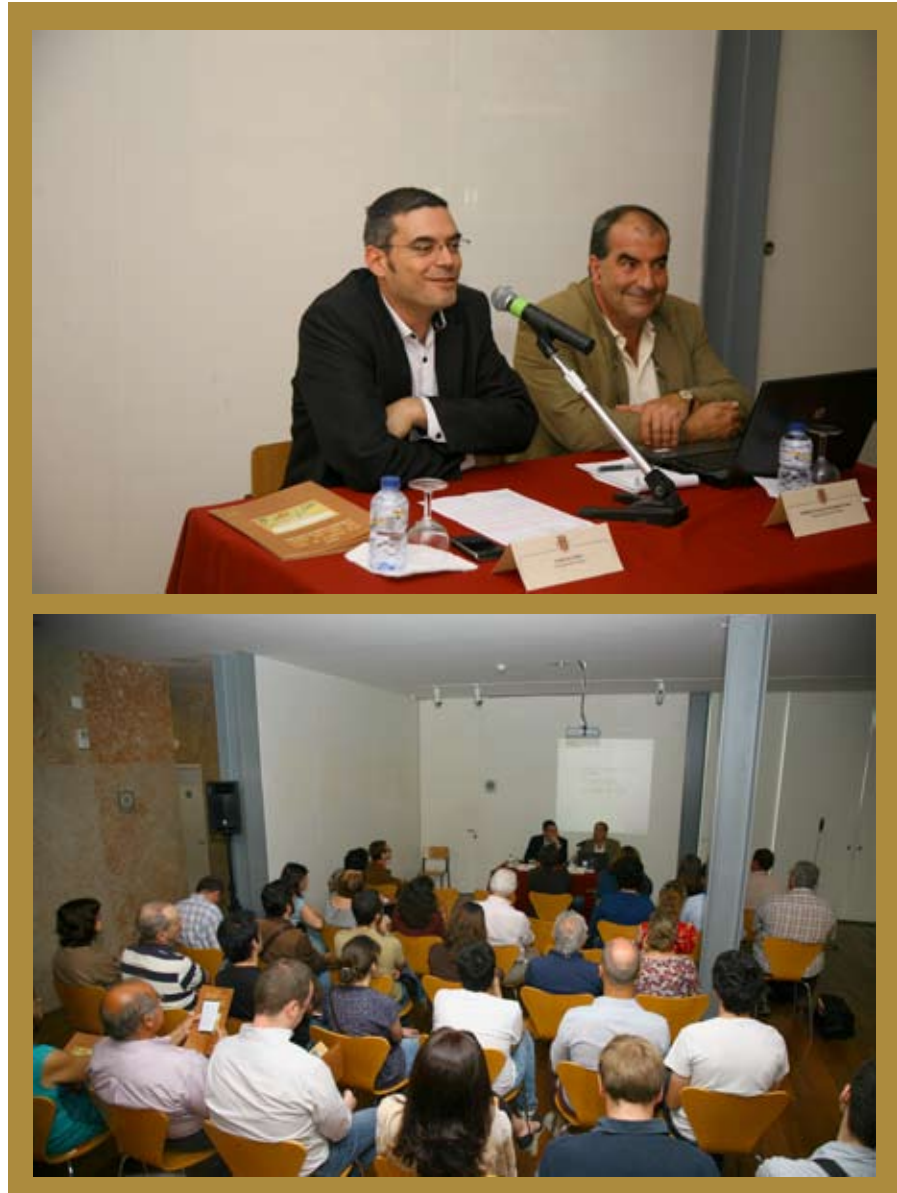
Fotografias da apresentação pública da Revista Cira Arqueologia N.º 1, no auditório do Museu Municipal de Vila Franca de Xira dia 20 de Junho de 2012.